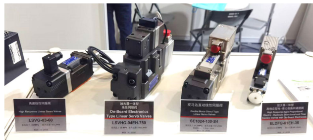
ELDF(H)G-EH シリーズ/LSV(H)G シリーズ LSV(H)G-EH シリーズ/SE1024