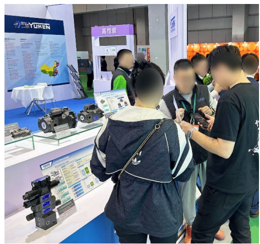
油研ブース来訪者